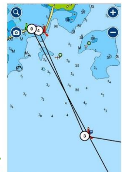
Detalle montada Coquimbo por estribor

Boya roja Km 23,5 Boya Eje- roja y blanca Boya Bajo Sara